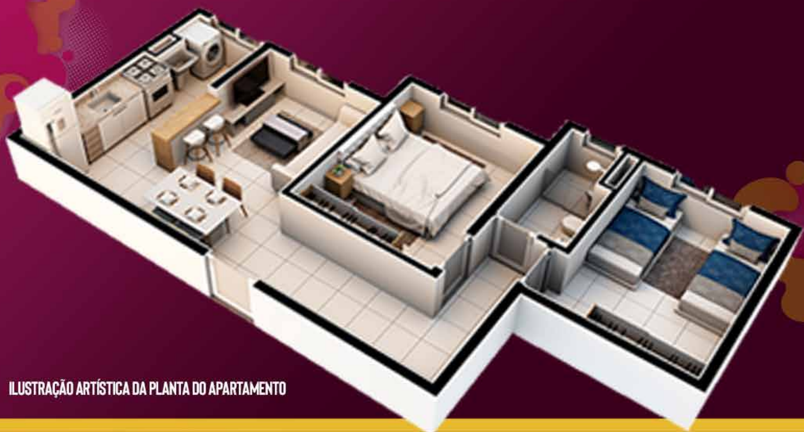
ILUSTRAÇÃO ARTÍSTICA DA PLANTA DO APARTAMENTO