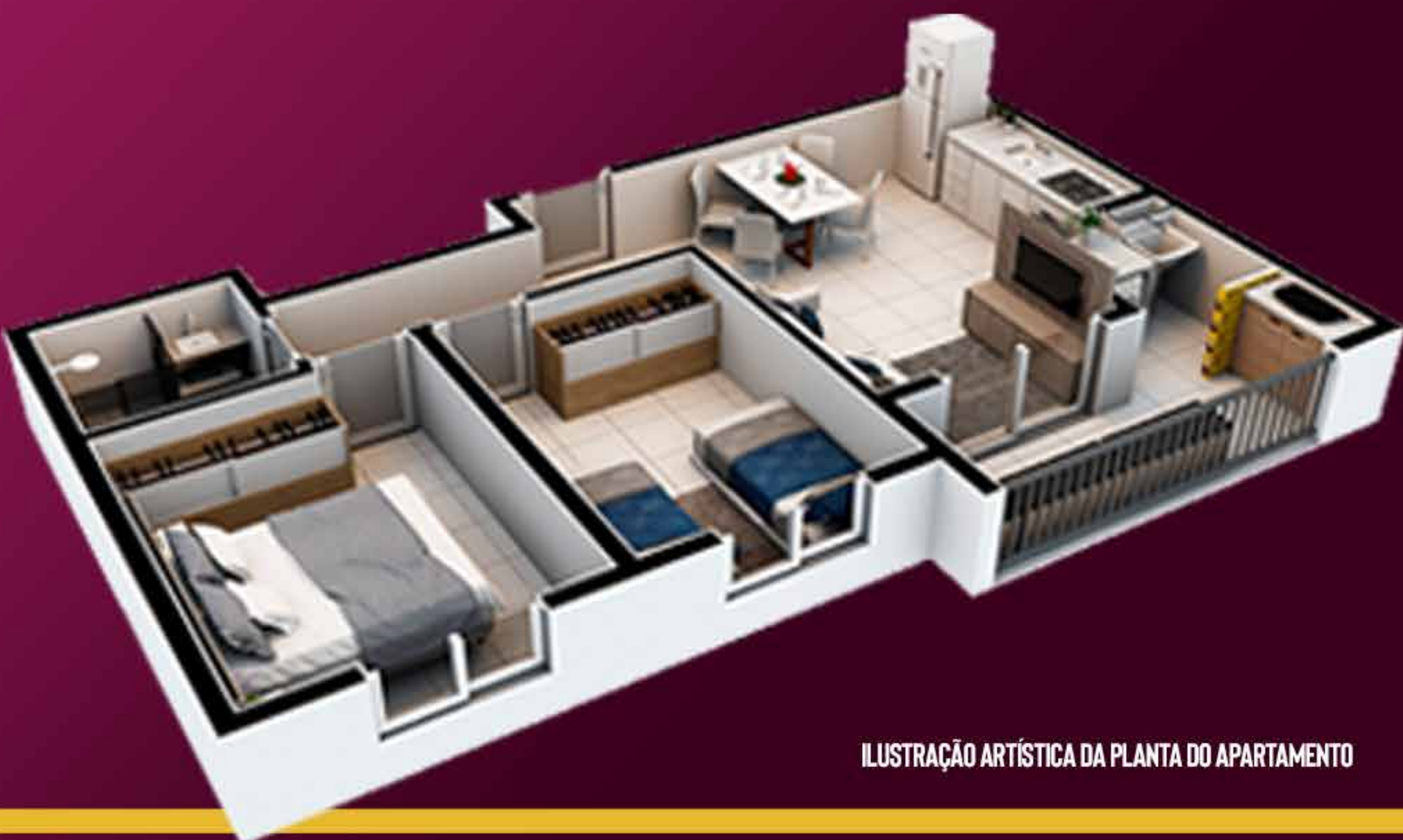
ILUSTRAÇÃO ARTÍSTICA DA PLANTA DO APARTAMENTO