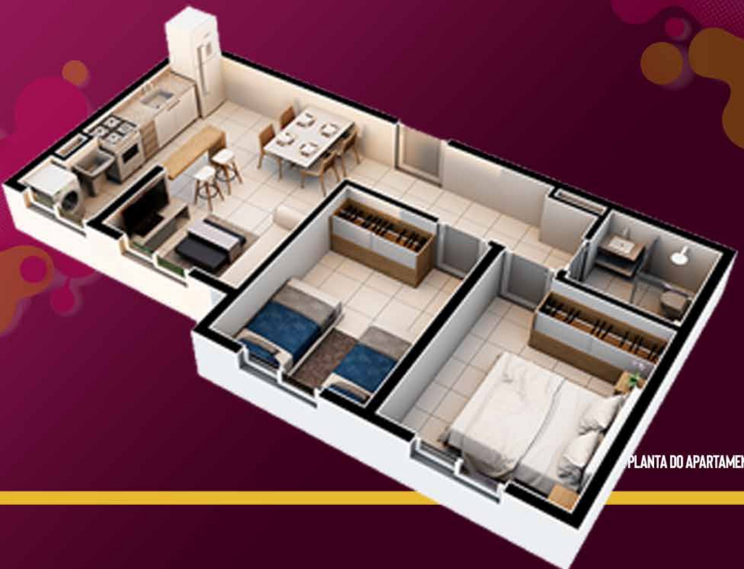
PLANTA DO APARTAMENTO