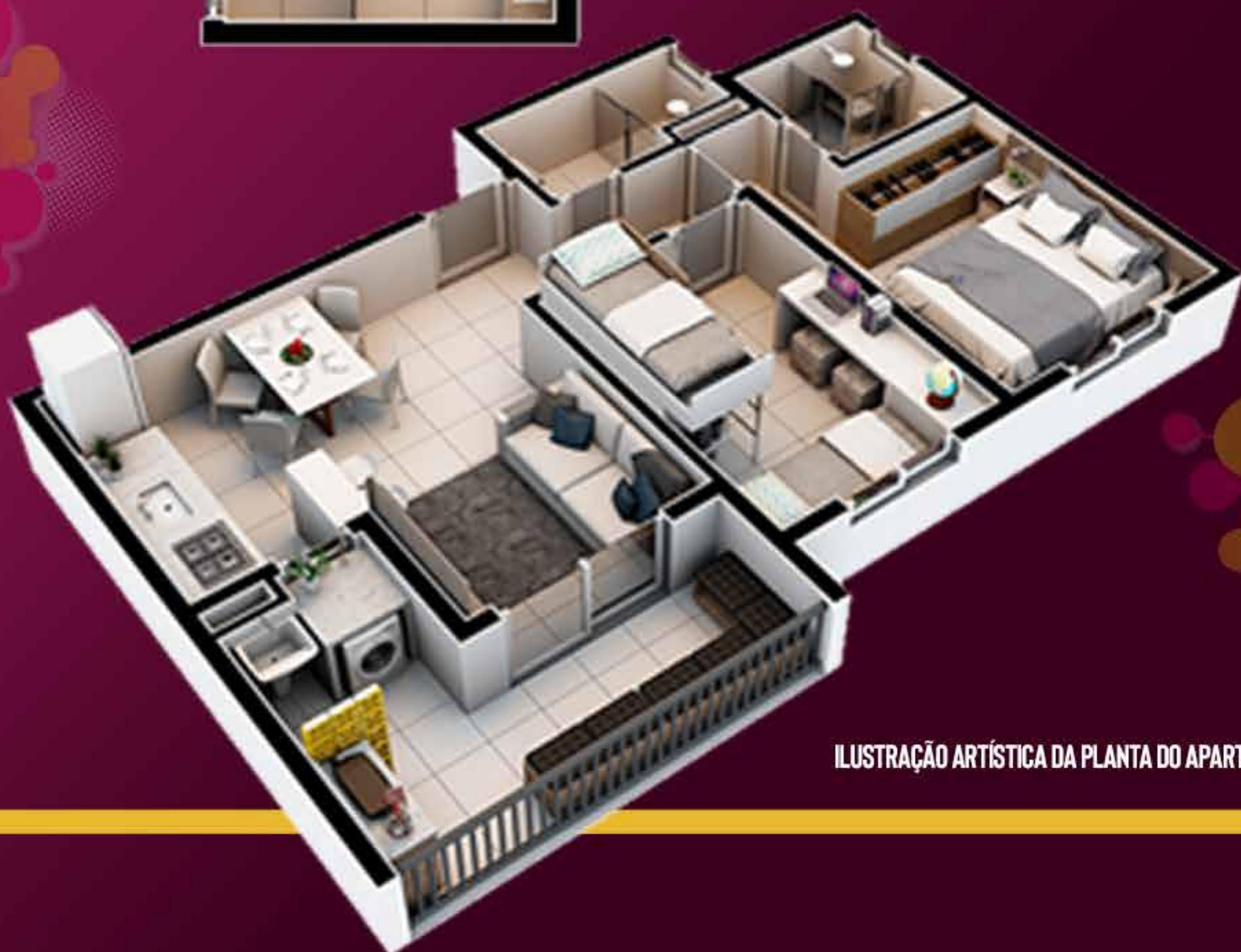
ILUSTRAÇÃO ARTÍSTICA DA PLANTA DO APARTAMENTO