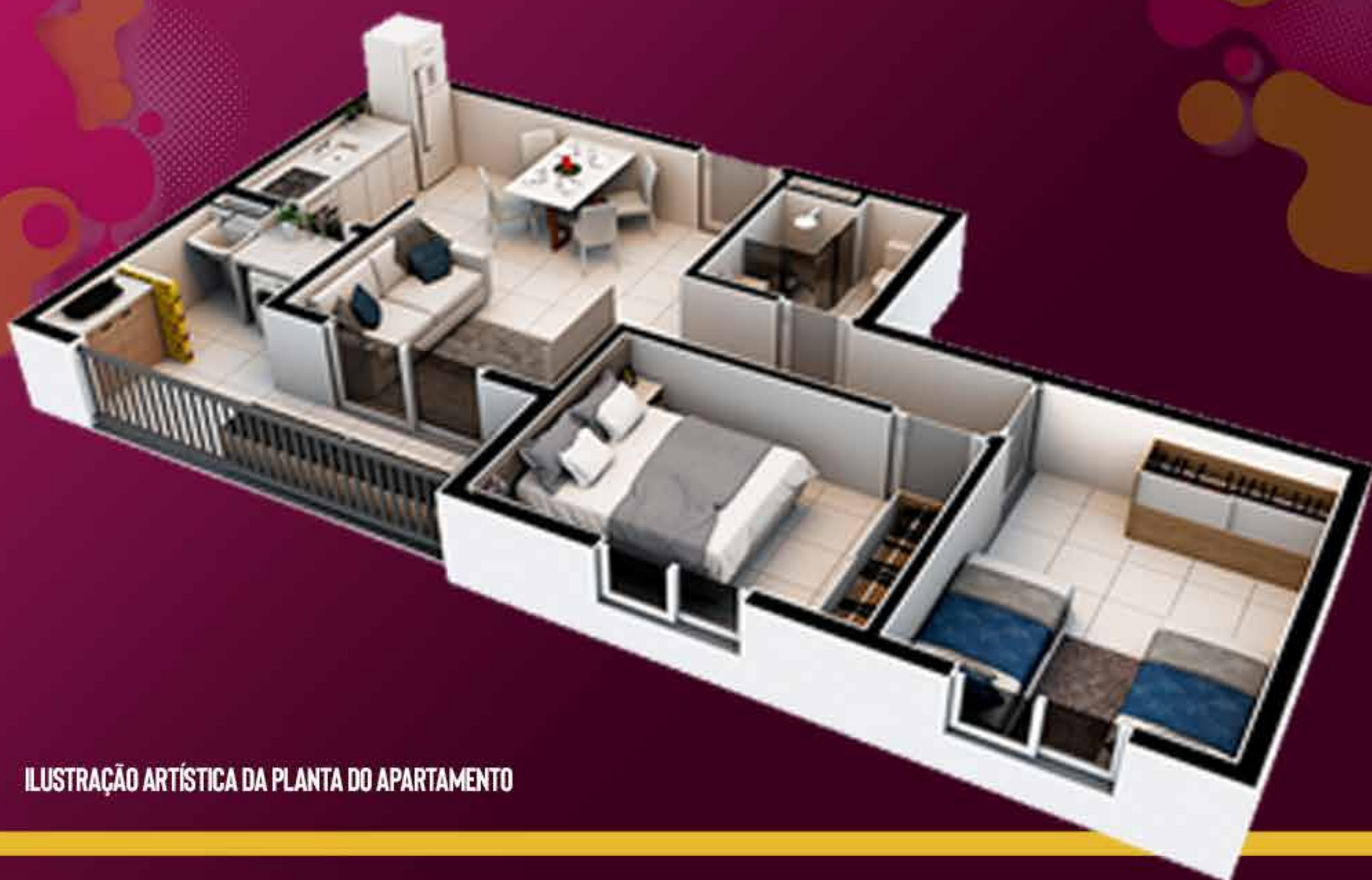
ILUSTRAÇÃO ARTÍSTICA DA PLANTA DO APARTAMENTO