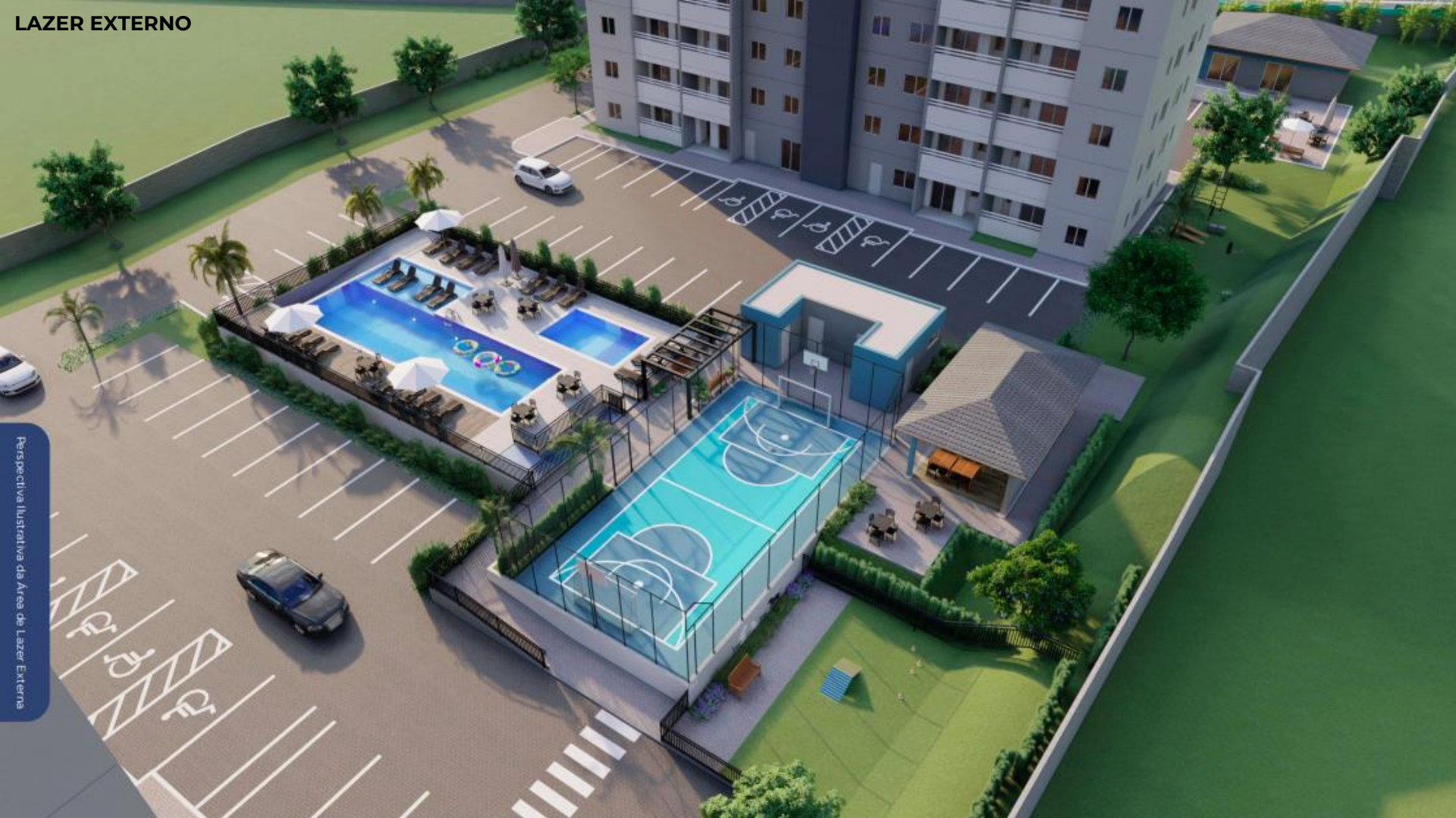
Perspectiva Ilustrativa da Área de Lazer Externa